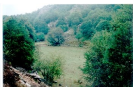
εγκαταλειμμένος αγρός στην περιοχή Οξιά, Μονοδένδρι

Για αιώνες η γεωργία έπαιξε έναν πολυδιάστατο ρόλο στον καθορισμό και τη διατήρηση της ορεινής βιοποικιλότητας στην Ευρώπη, μέσω της διαχείρισης των ενδιαιτημάτων, των ειδών και των τοπίων. Λόγω της μείωσης της αγροτικής δραστηριότητας, ενδέχεται να επηρεαστεί έντονα η ορεινή βιοποικιλότητα.