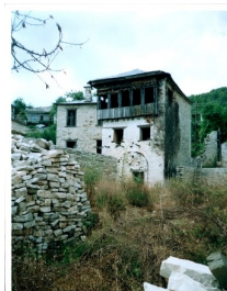
Αρχοντικό Πλακίδα, Κουκούλι